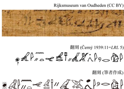
図 2 : ライデン書簡裏面 (I 370=AMS 38b) 19 行目の一節の写真と翻刻

図 2 は、ライデン書簡裏面 19 行目の一節の写真、Černý (1939) の翻刻、筆者の作成した翻刻を示したものである。また、言語記述の結果は (2) に示したとおりである 7 。